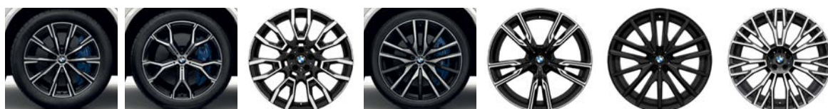
20英寸铝合金轮圈, 星式轮辐740M型, 双色