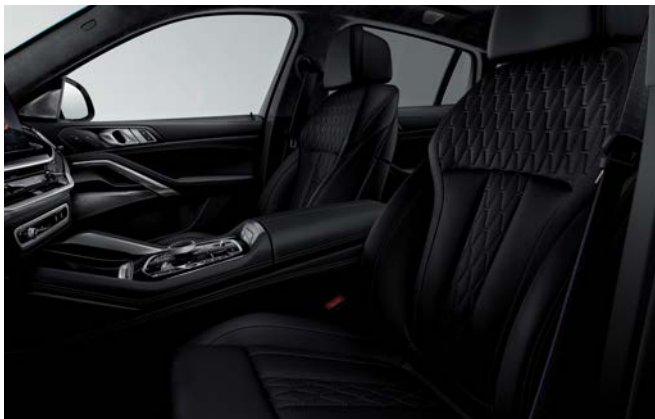
前排舒适型座椅, 电动调节