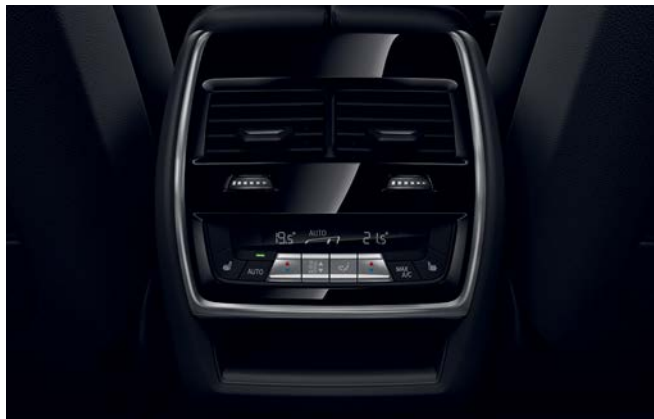
高级四区自动空调