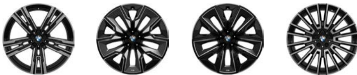
21英寸铝合金轮圈 星式辐条908M型, 双色