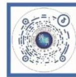
外交部领事直通车 抖音号