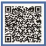
国家反诈中心 快手号