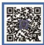
国家反诈中心 APP ios 下载