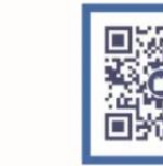
外交部领事直通车 哔哩哔哩号