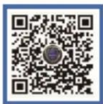
国家反诈中心 微信视频号