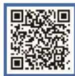
国家反诈中心 微博号