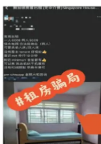
诈骗分子在群内发布虚假租房广告