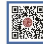
教育部平安留学 网站