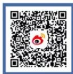
公安部刑侦局 微博号