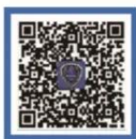
国家反诈中心 APP Android 下载

国家反诈中心APP是一款官方手机防骗保护软件，集诈骗预警提示、报案助手、线索举报、反诈宣传等多种功能于一体，可以有效提升用户的识骗防骗能力。