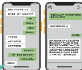
诱导受害人借钱投资

受害人前期小额投资试水一般会获得返利，但一旦加大资金投入，就会出现无法提现的情况，诈骗分子会再以缴纳保证金、个人所得税、解冻金等理由继续诱导转账，受害人最终会在转出大量资金后被踢出群聊并拉黑。