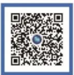
外交部领事直通车 快手号