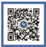
外交部领事直通车 微博号