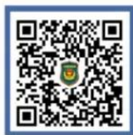
公安部刑侦局 微信视频号