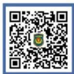
公安部刑侦局 微信公众号

公安部刑侦局、国家反诈中心、外交部领事保护中心、教育部留学服务中心开通官方政务号，全面解析高发诈骗类型，宣介海外反诈常识，发布海外反诈提醒，欢迎关注。