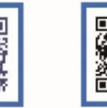
教育部平安留学 微信公众号